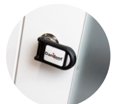
Lås som tillval