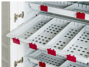
Korgarna delas enkelt av med flexibla avledare.