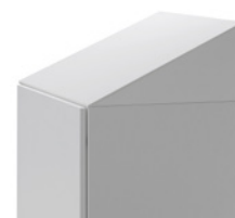
Snedtak som tillval