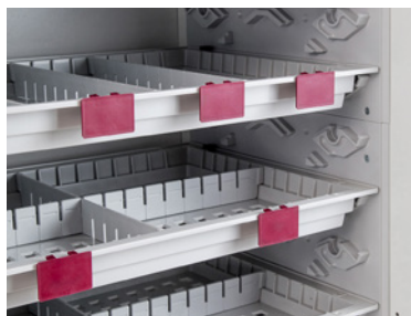
Etiketthållare för uppmärkning.

Fyll på varor i bakkant och plocka äldsta varan i framkant. När korgen dras ut tilltas korgen automatiskt framåt.