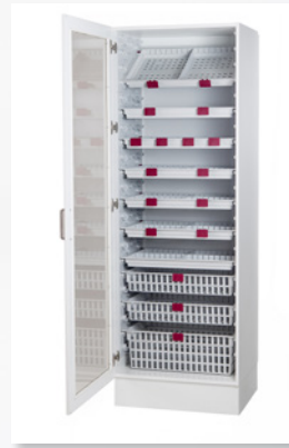
Vitrin som tillval

Backsystemet bygger på en ISO standard (korgstorlek 400x600mm). Välj mellan grunt och brett eller djupt och smalt skåp. Samma korg men olika ledder. En ISO-standardiserad, flexibel och modulär lösning av högsta kvalitet.